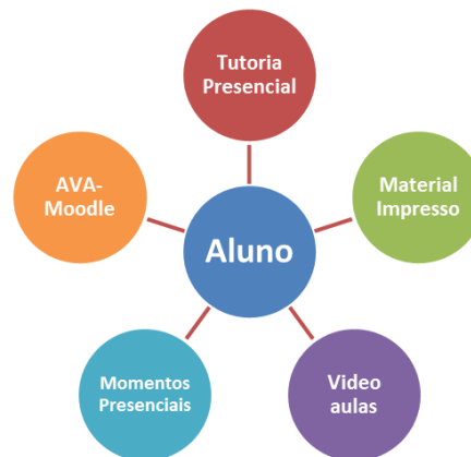
Figura 1: Estrutura disponibilizada para alunos nos cursos oferecidos na modalidade EaD na UECE

Neste curso, estarão disponíveis para os alunos: