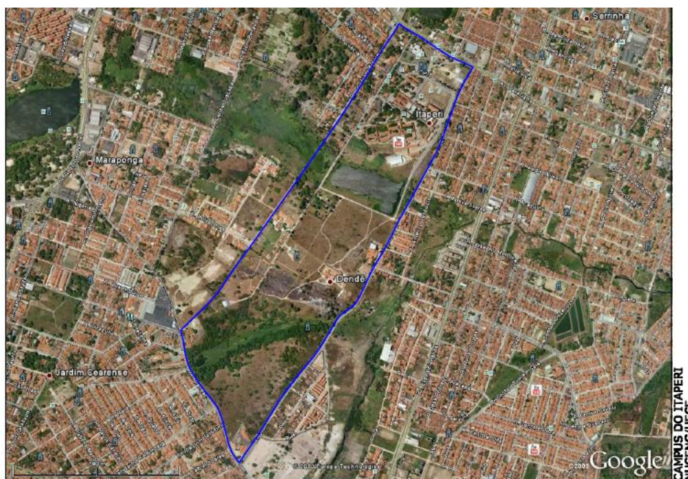
Figura 2 - Vista aérea do Campus do Itaperi, Fortaleza, Ceará.

A Universidade Estadual do Ceará localiza-se no Campus do Itaperi, mais precisamente na Av. Paranjana nº 1700 – Bairro Serrinha – Fortaleza - Ceará, abrangendo uma área total de 104 hectares (Figura 2).