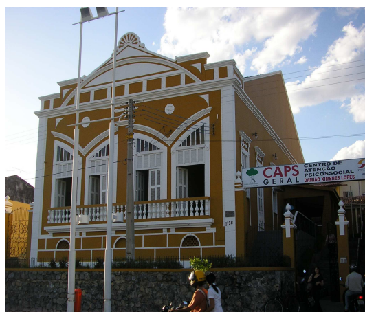
CAPS Geral II

A cidade de Sobral está localizada na região noroeste do Estado do Ceará. Desde o ano de 1997, o município vem se organizando progressivamente na incorporação de um sistema municipal de saúde, com o desenvolvimento de ações intersetoriais, onde o sistema de