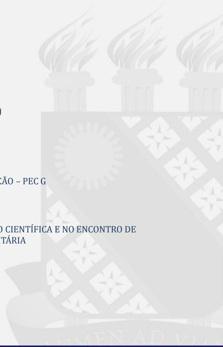
TABELA 45 - TRABALHOS INSCRITOS NO ENCONTRO DE INICIAÇÃO CIENTÍFICA E NO ENCONTRO DE PESQUISADORES REALIZADOS DURANTE A XXII SEMANA UNIVERSITÁRIA