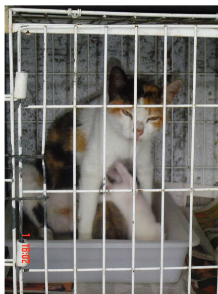
Figura 4. Gata amamentando sentada no ninho (25º dia pós-parto).