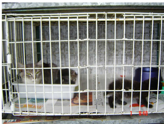
Figura 5. Filhote fora do ninho (24 o dia pós-parto).

Os valores que representam o tempo médio de permanência dos filhotes fora do ninho (Figura 5) não diferem estatisticamente entre a primeira e a segunda semana, aumentando ao longo da terceira e quarta semana, que diferiram estatisticamente entre si (Tabela 5).