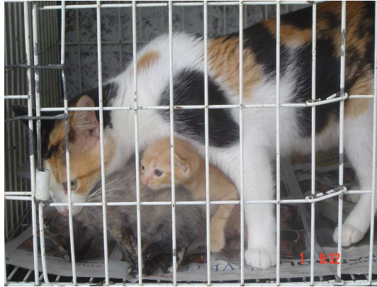
Figura 6. Gata transportando um dos filhotes imobilizando o filhote por apreensão na região cervical dorsal (28º dia pós-parto).

Na tabela 10, foi observado que gatas que possuem ninhadas de 1 a 3 filhotes permanecem isoladas mais tempo do que àquelas com ninhadas de 4 a 7 filhotes ao longo das 4 semanas de observação.