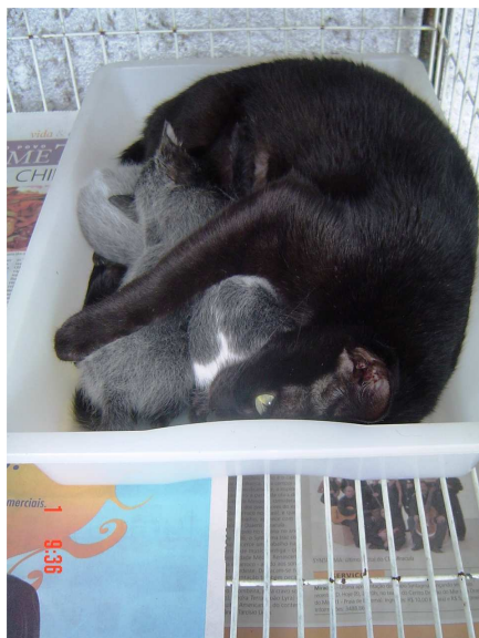
Figura 2. Gata amamentando dentro do ninho assumindo postura corpórea em semicírculo (23º dia pós-parto).

Para propiciar confiabilidade à avaliação estatística para comparação das médias que representam as diferentes posturas exibidas pela gata durante a amamentação ao longo das quatro semanas, as posturas decúbito dorsal e sentada foram reunidas na categoria “outras posturas” (Tabela 7). As médias que representam o percentual de ocorrência dos posicionamentos corpóreos em semicírculo, levemente rotacionada e outras se apresentam diferentes entre si ao longo de cada semana, denotando um mesmo perfil de proporção de posicionamento ao longo de todo período observacional. Ainda na tabela 7, nota-se uma diminuição da utilização da postura de amamentação em semicírculo ao longo das quatro semanas, no entanto registrou-se um aumento na frequência da postura do corpo levemente rotacionado até a terceira semana e manteve-se constante até a quarta semana. Na categoria “outras”, foi observado um aumento estatisticamente significativo da primeira até a última semana de observação.