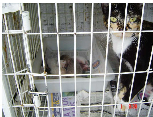
Figura 9. Gata isolada fora do ninho inativa (9º dia pós-parto).

Os percentuais das diferentes atividades executadas pelas gatas foram registrados na tabela 11. No presente trabalho, notou-se que na primeira semana o tempo médio em que as gatas permaneceram inativas apresentou-se estatisticamente inferior as médias obtidas nas três semanas seguintes, que se mantiveram constantes. O percentual de tempo que foi observado as gatas comendo ração manteve-se constante durante as três primeiras semanas, todas estatisticamente superiores à média observada na quarta semana.