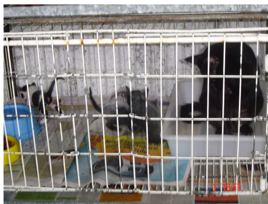
Figura 10. Gata isolada dentro do ninho e filhotes fora do ninho (26º dia pós-parto).