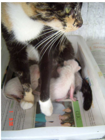
Figura 3. Gata amamentando sentada dentro do ninho (8º dia pós-parto).