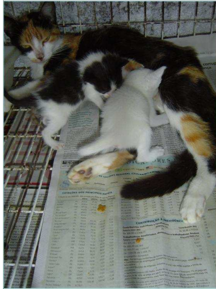
Figura 1. Gata amamentando seus filhotes fora do ninho (28º dia pós-parto).

Ainda na tabela 5, foram obtidos, a partir do tempo dedicado à amamentação, os percentuais em que o comportamento foi executado dentro e fora do ninho (Figura 1) ao longo das quatro semanas de observação.