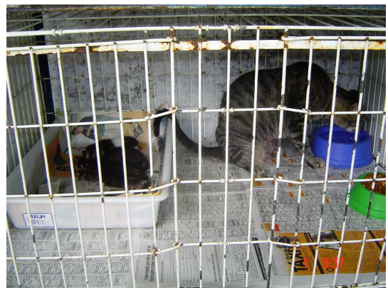
Figura 8. Gata isolada dos filhotes fora do ninho bebendo água (15º dia).