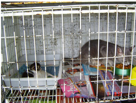
Figura 7. Gata isolada dos filhotes fora do ninho comendo (23º dia).

Os tempos médios de isolamento em gatas com ninhadas de 1 a 3 filhotes mantiveram-se constantes nas três primeiras semanas, aumentando somente na 4ª semana. Em gatas com ninhadas de 4 a 7 filhotes esse tempo manteve-se constante até a segunda semana, aumentando a partir da 3ª semana, onde observou-se a média semelhante a 4ª semana.