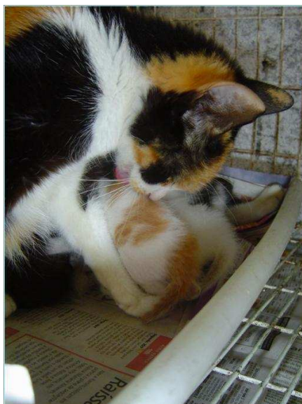
Figura 11. Gata realizando lambedura dentro do ninho direcionada ao corpo de um filhote (28º dia pós-parto).