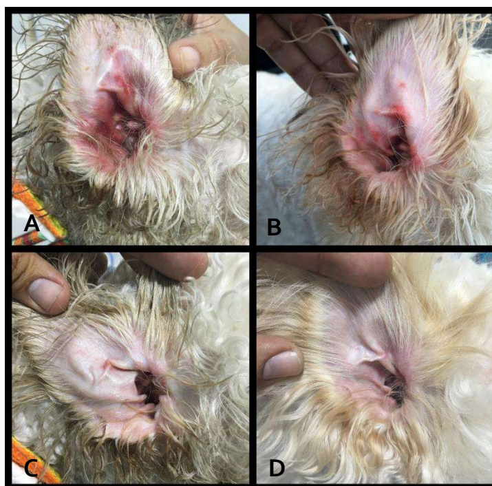
Figura 02: Condição clínica do pavilhão auricular no início da reação farmacodérmica.

A cultura bacteriana, realizada concomitante ao exame citológico, teve resultado negativo para crescimento de bactérias aeróbicas. Tais achados sugerem que a nova lesão foi ocasionada por reação farmacodérmica à medicação utilizada, sendo realizada a troca do medicamento por outra solução otológica composta por Orbifloxacino, Posaconazol e Mometasona. Após 10 dias da troca da medicação, a paciente apresentou remissão completa do quadro clínico, não sendo possível a visualização de eritema, dor e secreção auricular em ambos ouvidos (Fig. 02D).