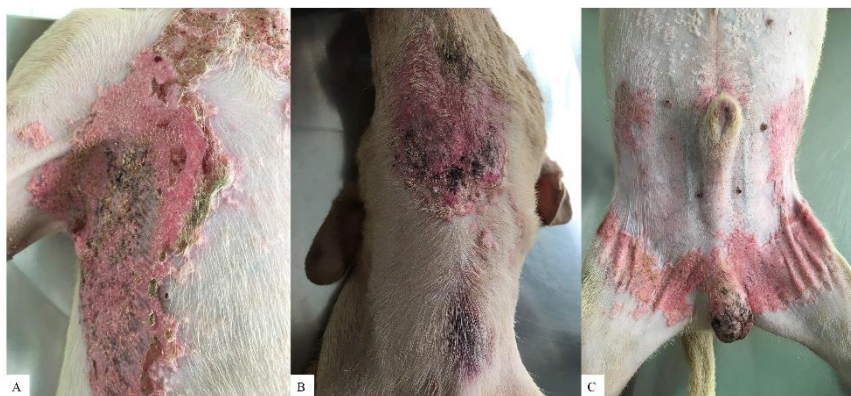
Figura 1 – Pele – Cão – Aspecto macroscópico das lesões de coloração rosada, crostosas, ulceradas e prostrusas em região axilar (A), ventral da face (B), abdominal e inguinal (C).

face e regiões dorsal, axilar, inguinal e lombar (Fig. 1). Macroscopicamente as lesões eram em sua maioria de coloração rosada, crostosas, contendo úlceras e pústulas, intercaladas por regiões brancacentas, prostrusas e de aspecto arenoso. Para avaliação histopatológica, foram removidos quatro fragmentos de pele envolvendo regiões axilar e inguinal. Após o retorno ao médico veterinário foi solicitado um exame ultrassonográfico abdominal.